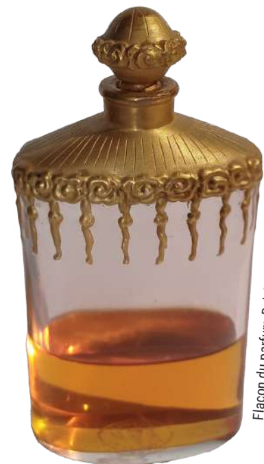
Flacon du parfum Bel été de Biette

Clémence Véran Passage Sainte-Croix cveran.passage@gmail.com 06 77 12 64 71