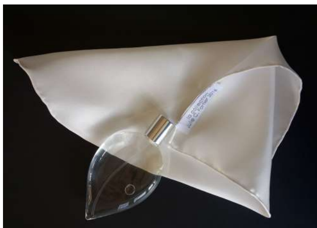
© Julie C. Fortier / l'Institut d'art contemporain, Villeurbanne/Rhône-Alpes

La Collection explore les paradoxes liés à la nature volatile des parfums et le besoin de posséder des collectionneurs. En collaboration avec le chimiste Olivier David, Julie C. Fortier utilise des molécules généralement négligées par les parfumeurs, car elles sont trop éphémères. Ce parfum, à appliquer sur une pochette de soie blanche, disparaît en cinq minutes, laissant seulement un fantôme olfactif. Pour renouveler l'expérience, il faut le réappliquer, soulignant la nature fugace et insaisissable de cette œuvre.