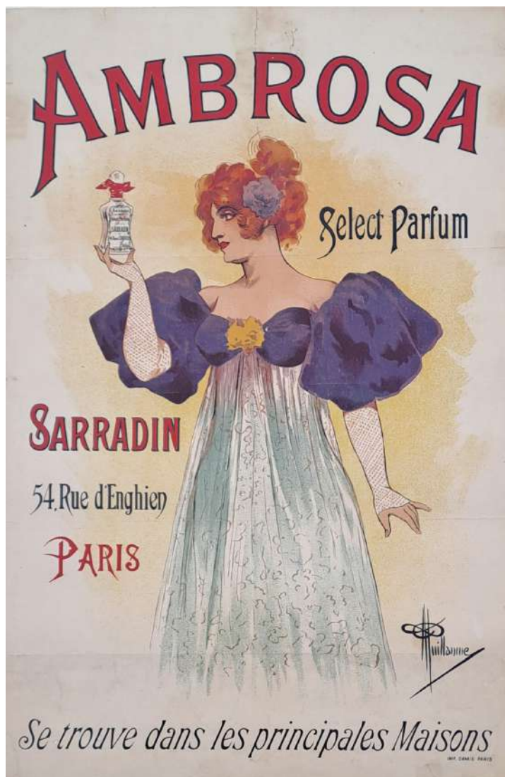
Affiche Select Parfum Ambrosa 1900 (Collection particulière)