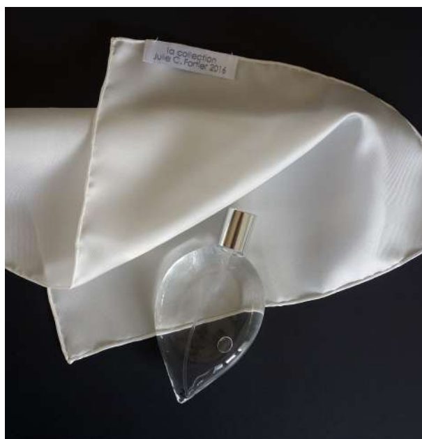
© Julie C. Fortier / Institut d'art contemporain, Villeurbanne/Rhône-Alpes